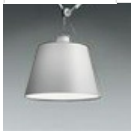
TOLOMEO MEGA/DEC DIFFUSORE RASO D.240 0781050A