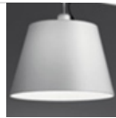
TOLOMEO MEGA DIFF.RASO 360 0781020A