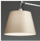
TOLOMEO MEGA DIFF.PERG.320 0780010A