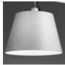
TOLOMEO MEGA DIFF.RASO 320 0781010A