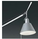
TOLOMEO SOSP.DEC.SOLO DIFF.METALLO 0371050A