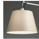
TOLOMEO SOSP.DEC.SOLO DIFF.PERGAMENA 0372050A