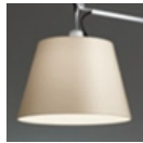
TOLOMEO MEGA DIFF.PERG.360 0780020A