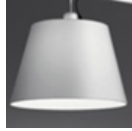
TOLOMEO MEGA DIFF.RASO 320 0781010A