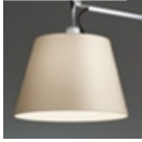
TOLOMEO SOSP.DEC.SOLO DIFF.PERGAMENA 0372050A