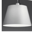
TOLOMEO MEGA DIFF.RASO 360 0781020A