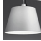
TOLOMEO MEGA DIFF.RASO 420 0781030A