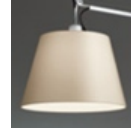
TOLOMEO MEGA DIFF.PERG.420 0780030A