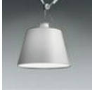
TOLOMEO MEGA/DEC DIFFUSORE RASO D.240 0781050A