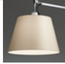
TOLOMEO MEGA DIFF.PERG.320 0780010A